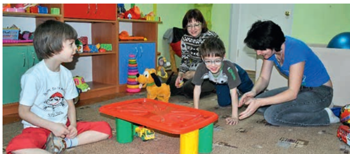
Релаксация в сенсорной комнате